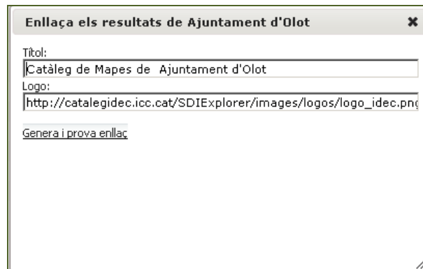
Il·lustració 2. Diàleg personalització vincle.

Ahora de generar aquest vincle és possible personalitzar el títol i logotip que es mostrarà a la pàgina resultant.